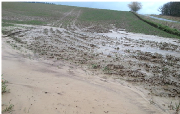
Erosionsereignis mit Bodenabtrag

Gefördert wird die Neuanlage und Pflege von Erosionsschutzstreifen auf Ackerflächen mit förderfähigen Kulturen.